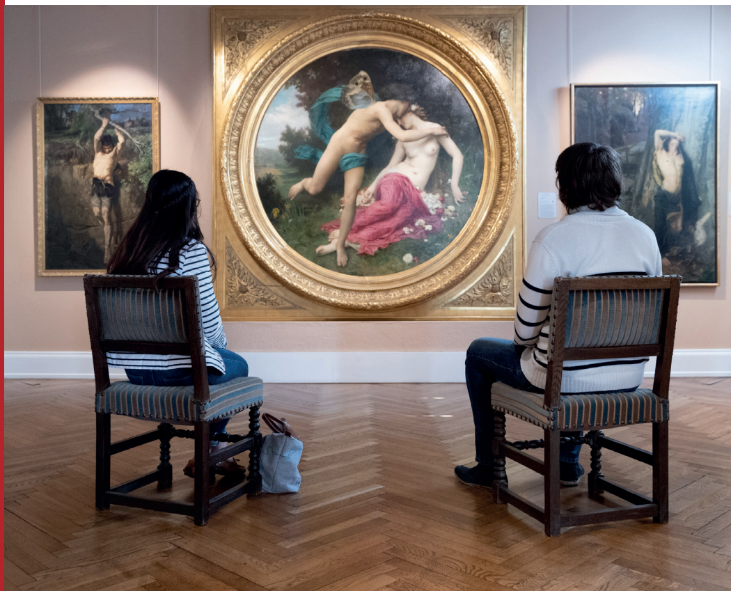
Salle d'Histoire

Le Musée des Beaux-Arts présente une sélection de 115 œuvres d'art du 15 e siècle à l'art moderne. Dans la première salle du parcours sont exposées des peintures et sculptures médiévales provenant pour la plupart d'édifices religieux de la région, de Strasbourg à Bâle. Les écoles française, flamande, hollandaise et italienne des 17 e et 18 e siècles comportent plusieurs chefs-d'œuvre de peintres célèbres (Boucher, Bruegel le jeune, Ricci) ou moins connus. La peinture française des années 1860-1914 et la peinture régionaliste constituent le point fort de la collection.