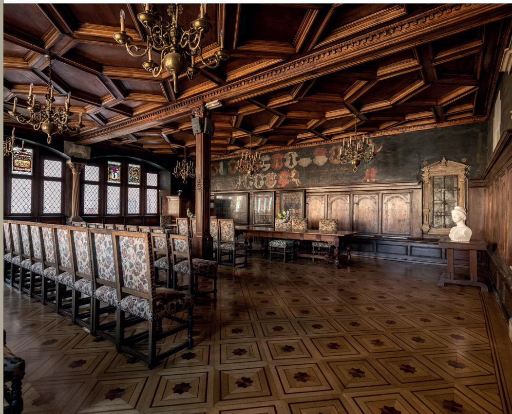
Salle du Conseil

Le musée dispose de collections très riches, composées notamment de meubles et de costumes, d'outils et de jouets, de plans et de portraits avec en particulier le célèbre Klapperstein, la statue du Sauvage et les marottes ou les reconstitutions d'intérieurs (chambre et cuisine du Sundgau). Une salle est également consacrée au mulhousien Alfred Dreyfus.