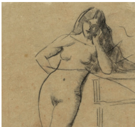
Jean-Jacques Henner, Etude d'après l'Eglogue