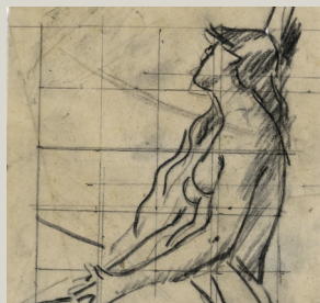
JJ Henner, Etude d'après la Magdeleine

Conférence proposée dans le cadre de l'exposition Jean-Jacques Henner dessinateur