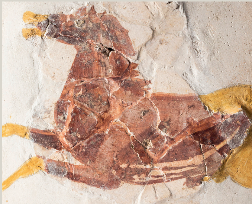
Fragment de fresque représentant un cheval, 2 e siècle

Le site archéologique situé au centre-ville d'Illzach est connu depuis le 18 e siècle. Identifiés comme la station gallo-romaine d'Uruncis, les vestiges les plus anciens datent du 1 er siècle de notre ère.