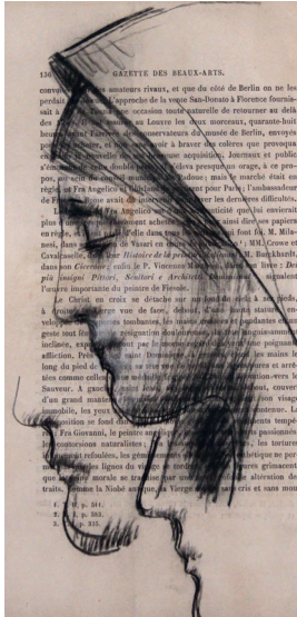
Jean-Jacques Henner, Tête de femme au voile , Musée National JJ Henner

Tous les dimanches retrouvez un rendez-vous "Muséo" au Musée Historique ou au Musée des Beaux-Arts