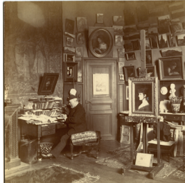
Photographie atelier Henner, © Musée JJ Henner