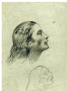
Jean-Jacques Henner, Etude pour Mère suppliant sa fille de renoncer à ses sentiments de chrétienté