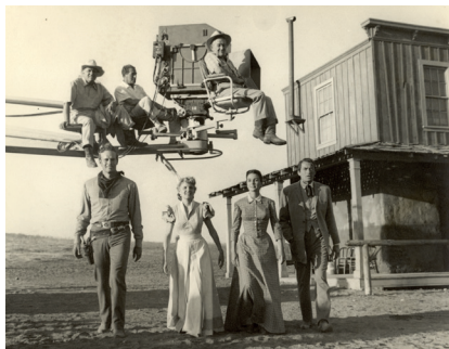
Les grands espaces

Toutes les semaines retrouvez un rendez-vous "Muséo" au Musée Historique ou au Musée des Beaux-Arts