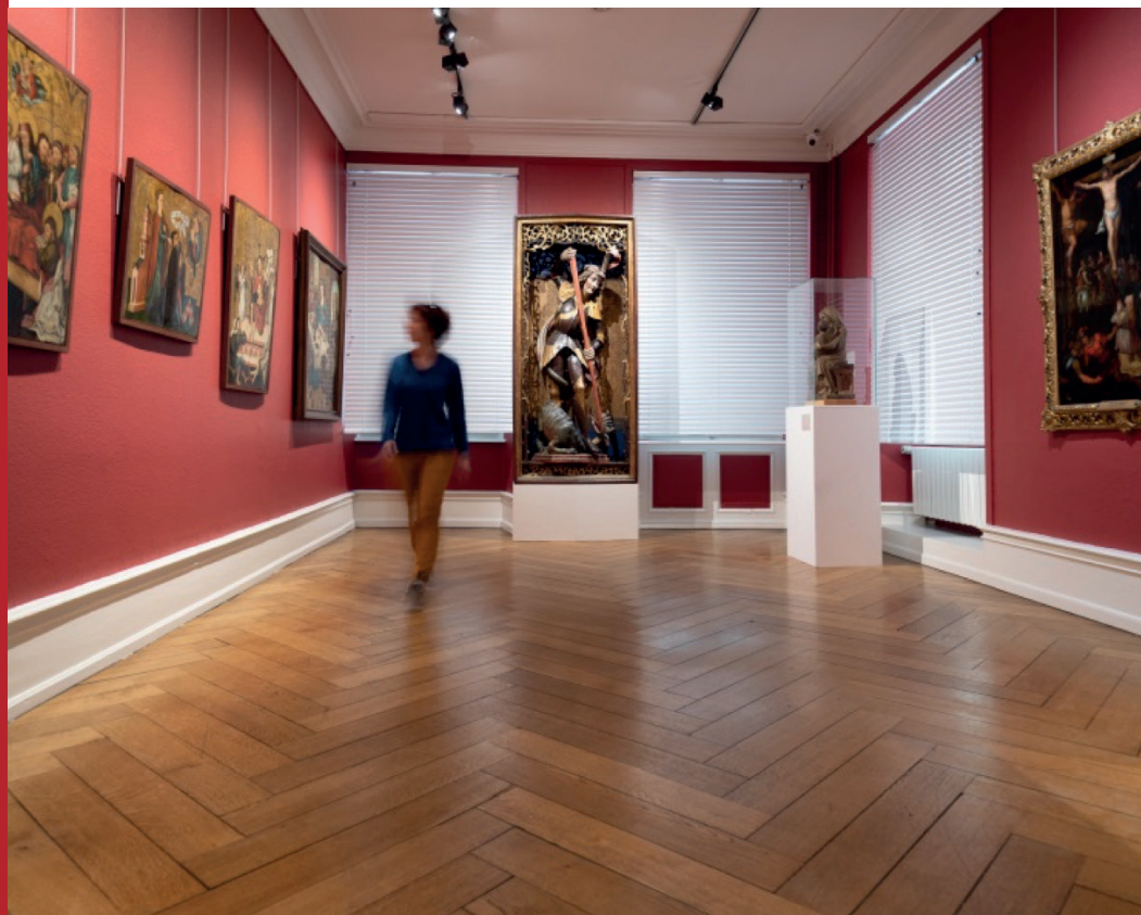
Salle Moyen-Âge

Le Musée des Beaux-Arts, labellisé Musée de France, présente une collection d'œuvres d'art du 15 e au 20 e siècle des écoles françaises, flamandes, hollandaises, allemandes et italiennes. La peinture des années 1860-1914 constitue le point fort de cet ensemble. Découvrez ce musée hébergé à la Villa Steinbach, bâtiment du 18 e siècle qui se distingue par son charme et son élégance. Sa très belle collection, constituée à l'origine par les membres de la Société Industrielle de Mulhouse, vous permet de plonger dans les œuvres de Jean-Jacques Henner, Brueghel le Jeune ou encore de William Bouguereau. Sans oublier les nombreuses expositions temporaires et animations pour adultes et enfants !