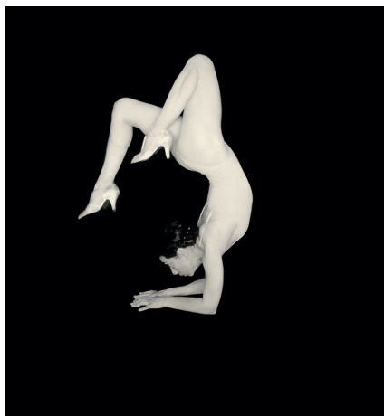
En équilibre III © Agnès Geoffroy

En partenariat avec la librairie 47°Nord, Mulhouse.