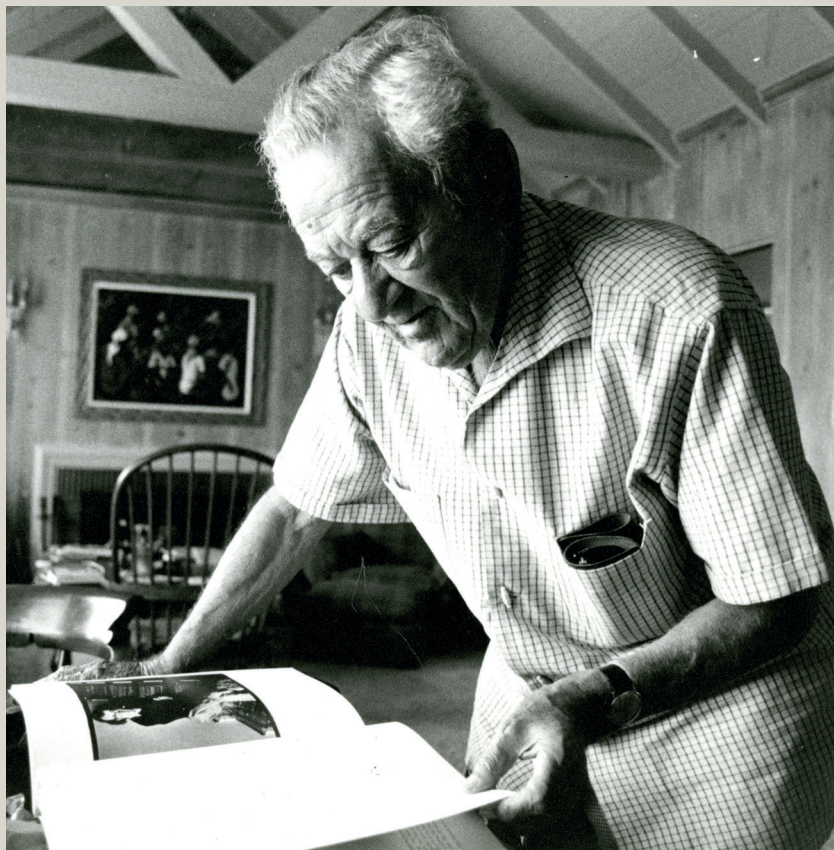
William Wyler chez lui

L'exposition retrace en 25 kakemonos la vie et l'œuvre de William Wyler, de Mulhouse jusqu'à Hollywood.