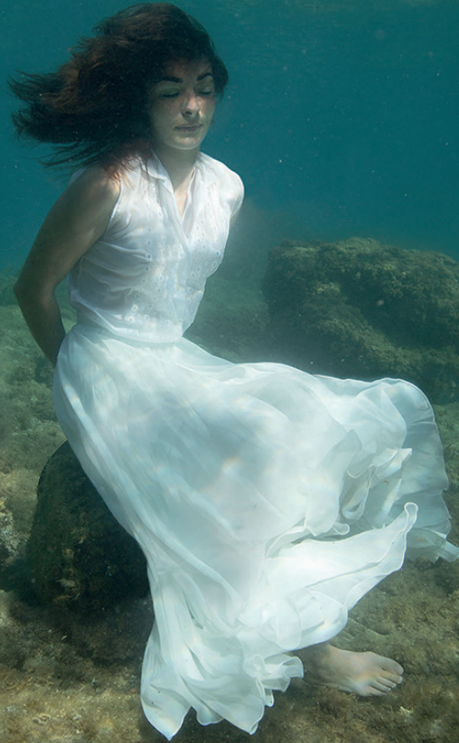
L'abandonnée , ©Agnès Geoffroy