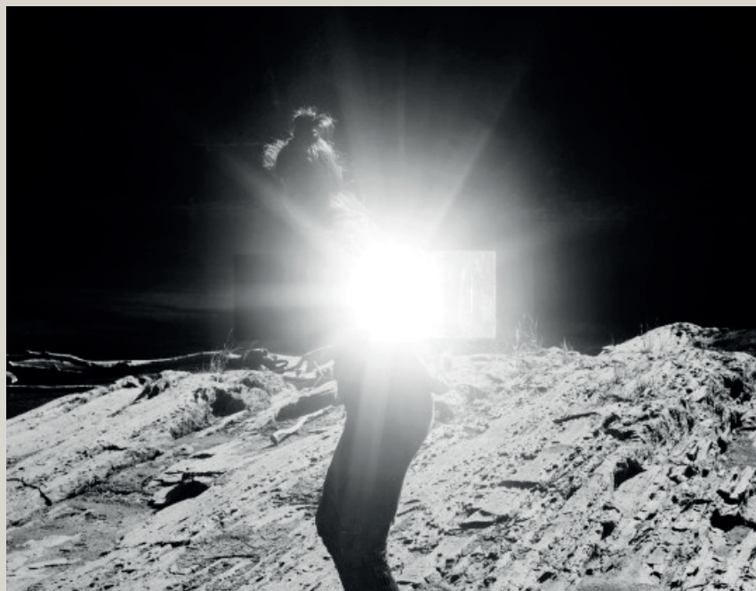
Soleils fantômes, © Sarah Ritter, 2022

Exposition dans le cadre de la Biennale de la Photographie 2022 - CORPS CÉLESTES