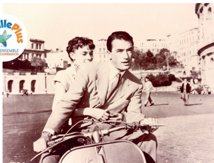
Vacances romaines © Wyler