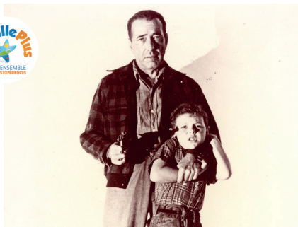
La maison des otages © Wyler