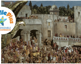
Ben Hur © Wyler