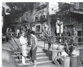
Rue sans issue © Wyler

Film des élèves des collèges Wolf, Villon et Bourtzwiller. Un making-of de 12 minutes réalisé par Art' Soc' retrace toute cette aventure cinématographique : première rencontre de ces élèves issus de quartiers mulhousiens différents ; découverte de la vie et des films de William Wyler ; écriture et tournage du court-métrage. Présence du réalisateur Olivier Arnold et de quelques élèves.