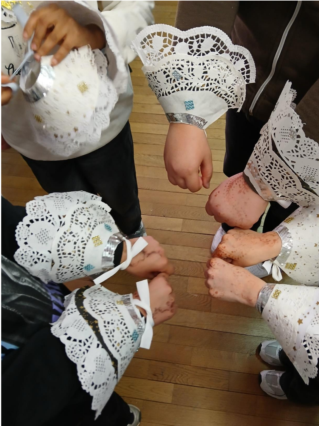
Pass culture costumes